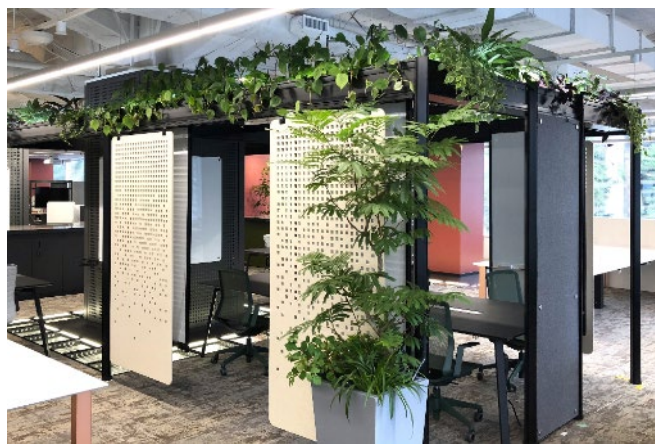
『Botanical Canopy（ボタニカルキャノピー）』

第一園芸では、無機質になりがちなオフィス空間に本物の植物を取り入れ、成長する植物とともに過ごせるオフィスアイテムを製作いたしました。近年、話題となっているバイオフィリックデザインとしてはもちろんのこと、水を循環するシステムにより植物がオフィス空間になじみやすくなり成長していきます。