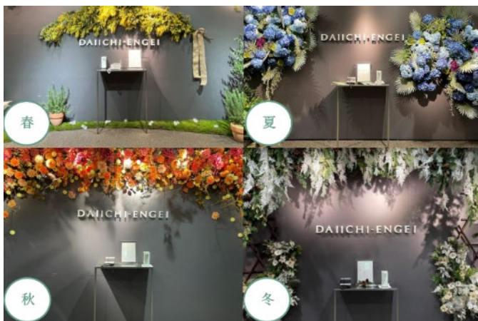
第一園芸本社のエントランスを季節ごとに装飾