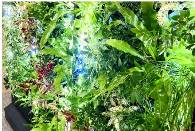
植物育成ライト、水の循環システムと自動灌水装置により室内でも植物が生育します