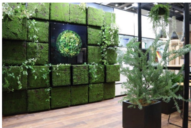
シートや展示用 BOX を繰り返し使用することで廃棄削減に

マグネット加工の特殊な壁面により、簡易的に模様替えが可能です。壁面の背景や、棚什器などの交換もマグネットの脱着のみですので、施工時間の短縮にも効果的です。ベースとなるマグネットウォールを取り付けることで、その後のレイアウト変更への作業効率があがりコスト削減にもつながります。