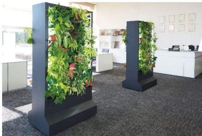
『Botanical Partition（ボタニカルパーティション）』

（※『Botanical Partition（ボタニカルパーティション）』は商標登録出願中）