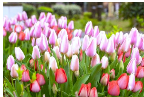
約 80 品種のチューリップをご用意

《本件に関する報道関係からのお問い合わせ》第一園芸株式会社 ブランド推進部 岡本