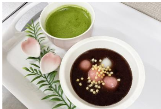
春のなごみセット 550円（税込）