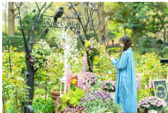
2023年のフォトスポット