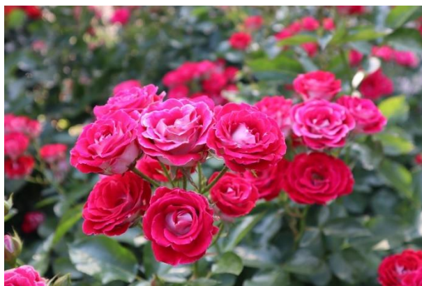
この秋おすすめの“岳の夢”

昨年、ハロウィンイベントとして開催したパレードの大盛況をうけて、今年はハロウィンならではのスタンプラリーイベントを開催いたします。ハロウィン気分を楽しみたい方はイベント日に、ゆったり落ち着いて秋バラを楽しみたい方はあえてイベント日を外した日にご来場いただくのもお勧めです。