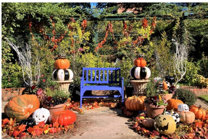
香りのローズガーデンフォトスポット