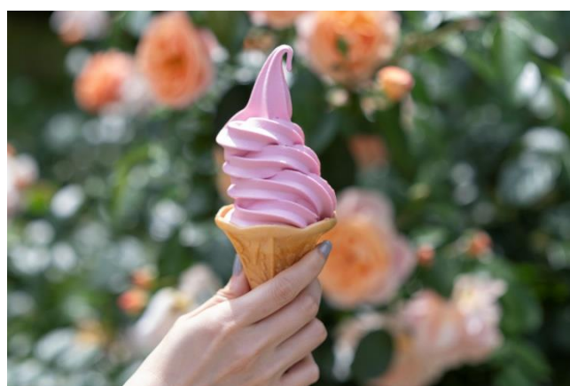
ローズソフト 400円（税込）