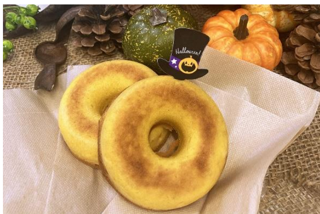
米粉で作ったカボチャの焼きドーナツ 1個 250円（税込）