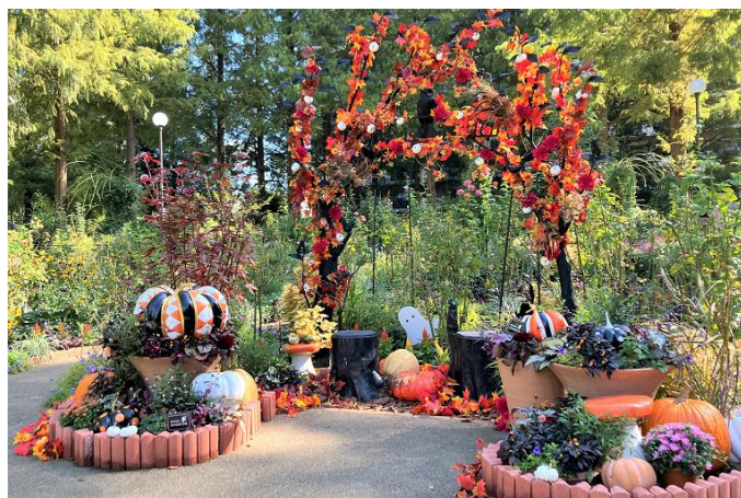
色彩のローズガーデンフォトスポット