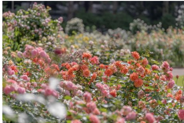
過去の園内の様子

練馬区立四季の香ローズガーデンでは、バラが一年で最も美しい姿を見せる春の最盛期※を迎えます。今年は、昨今の温暖化による気候を考慮し、耐暑性の強いバラを新たに加えた 342 品種が植栽され、621 株のバラが彩り豊かに咲き誇ります。春に見頃を迎える"春バラ"は、冬から春に向けて徐々に暖かくなるのと同時に、冬の休眠期に蓄えたエネルギーを使いゆっくりと成長し、大きく華やかな花を咲かせるのが特徴です。園内では、爽やかな紅茶の香りを感じる園のシンボルローズ「四季の香」をはじめ、さまざまなバラが次々と開花します。ダマスクやスパイシーなど 6 種類の香りを楽しめる「香りのローズガーデン」と赤やピンクなどパレットのように色とりどりのバラが咲く「色彩のローズガーデン」が豊潤な香りと華やかな春バラで包み込まれます。