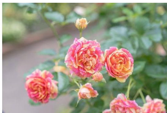
シンボルローズ“四季の香”

練馬区立四季の香ローズガーデンでは、バラが一年で最も美しい姿を見せる春の最盛期※を迎えます。今年は、昨今の温暖化による気候を考慮し、耐暑性の強いバラを新たに加えた 342 品種が植栽され、621 株のバラが彩り豊かに咲き誇ります。春に見頃を迎える"春バラ"は、冬から春に向けて徐々に暖かくなるのと同時に、冬の休眠期に蓄えたエネルギーを使いゆっくりと成長し、大きく華やかな花を咲かせるのが特徴です。園内では、爽やかな紅茶の香りを感じる園のシンボルローズ「四季の香」をはじめ、さまざまなバラが次々と開花します。ダマスクやスパイシーなど 6 種類の香りを楽しめる「香りのローズガーデン」と赤やピンクなどパレットのように色とりどりのバラが咲く「色彩のローズガーデン」が豊潤な香りと華やかな春バラで包み込まれます。