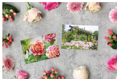
初の販売となるオリジナルポストカード