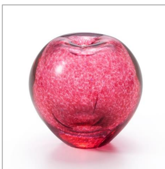
まるで本物のりんごのような風合い