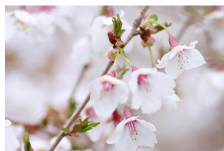
画像はイメージです