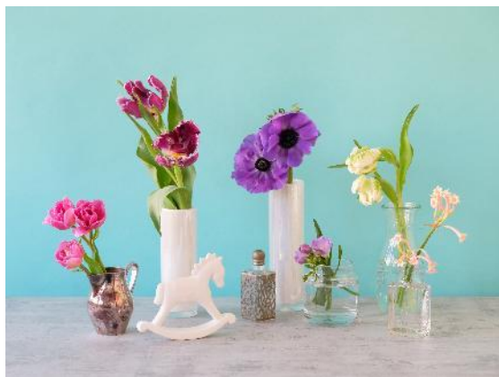
画像はイメージです