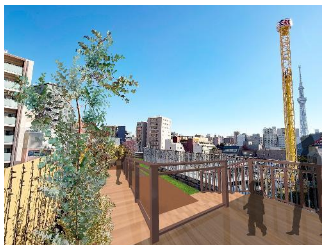
段々状のウッドデッキで構成されたエリア