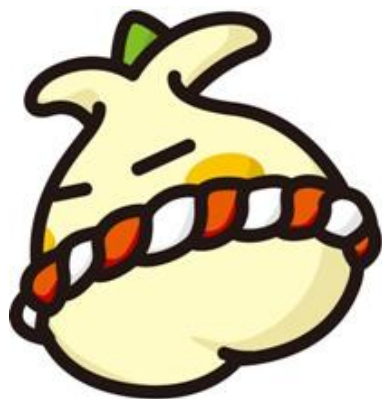
球根の神様「ブラ坊さん」