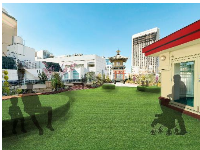
様々な場所で心地よくくつろげるデザイン

さらに、多くの方に楽しんでいただけるようウッドデッキによるバリアフリー経路を設置。木のぬくもりを感じながら季節を彩る草花がみなさまをお出迎えいたします。